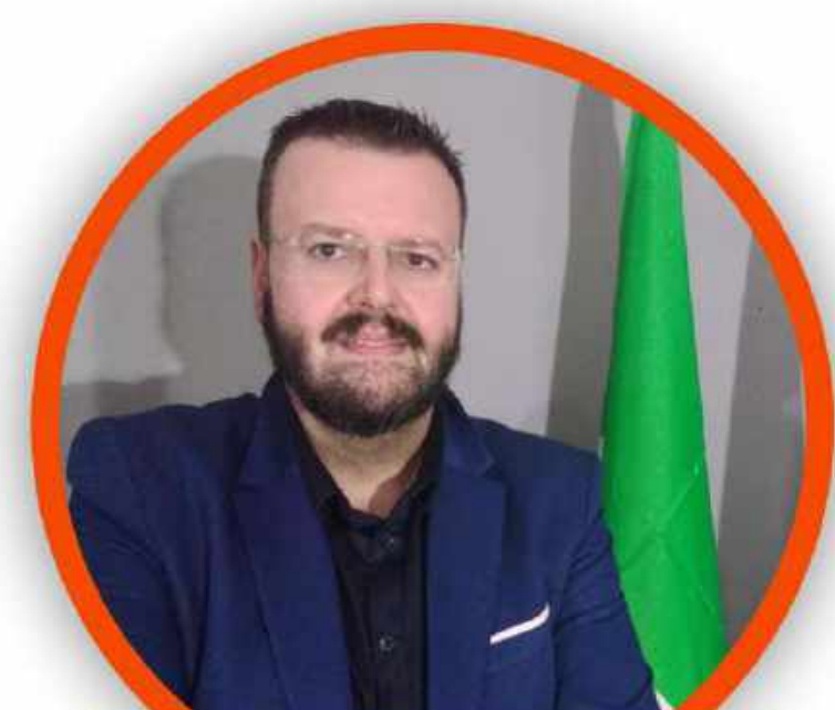
GIUSEPPE FAVILLA SECONDARIA DI SECONDO GRADO

DOCENTI, ATA, INSEGNANTI DI RELIGIONE PER LA SCUOLA